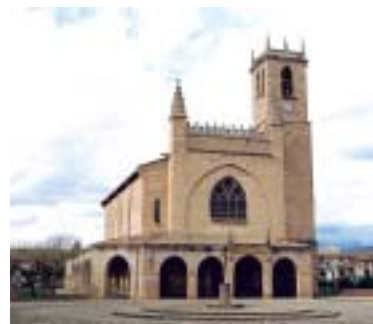
Iglesia junto a la que se representa el "Misterio de Obanos".

Muy conocida es también la historia de San Guillén y Santa Felicia, que se representa en el denominado "Misterio de Obanos". Felicia realizó el Camino de Santiago y a su vuelta renunció a sus privilegios como princesa de Aquitania y se quedó a servir en Amocáin (pueblo del Valle de Egúés). Su hermano Guillén, al no convencerla para regresar, le dio muerte y arrepentido peregrinó a Santiago y de regreso se recluyó en la ermita de Arnotegui.